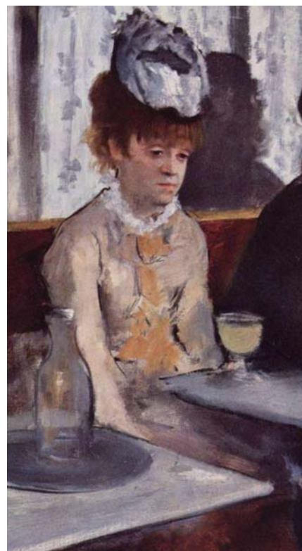
▲ La « Buveuse d'absinthe » d'Edgar Degas, représentation de la détresse liée à la dépendance à l'alcool

Infos : association Vivre sans alcool, 04 76 53 24 15, ou vivre-sans-alcool@orange.fr - http://vsa.grenoble.free.fr .