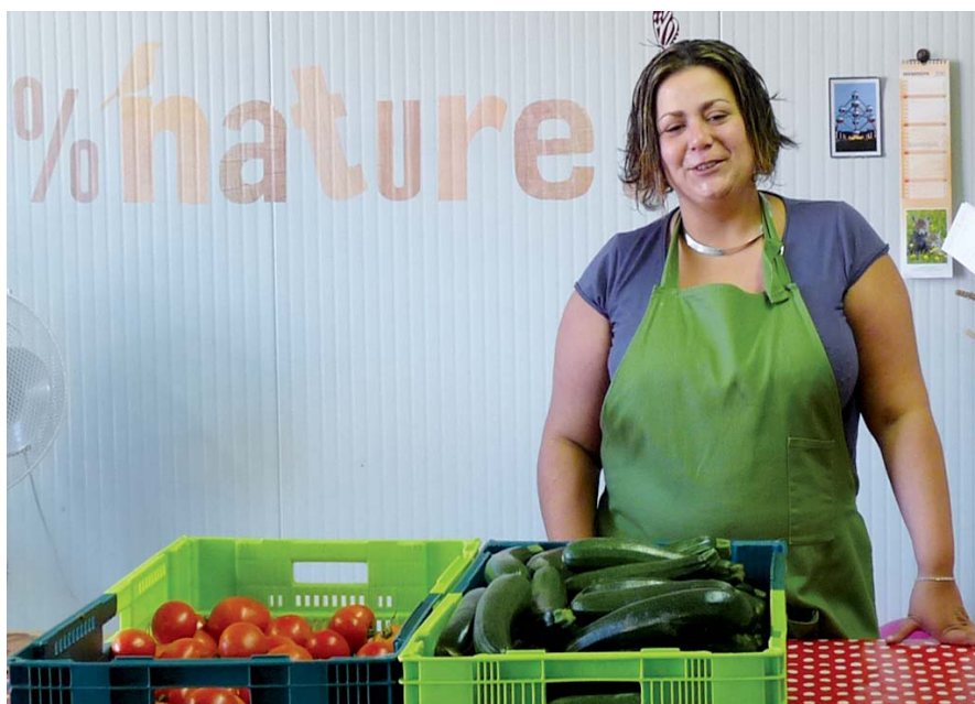
▲ De beaux légumes et le sourire en prime !