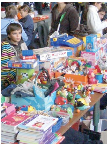
▲ Petits et grands trouveront leur bonheur au détour d'un stand

La brocante du petit Sassenageois, dimanche 7 novembre au gymnase des Pies de 9h30 à 17h. Infos : 04 76 26 50 99.