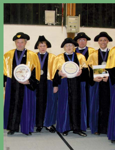
▲ La Confrérie du Bleu Vercors-Sassenage

Toujours fidèle pour fêter Sainte-Cécile, la patronne des musiciens, l'orchestre d'harmonie l'Echo des Caves vous convie à deux rendez-vous en son honneur :