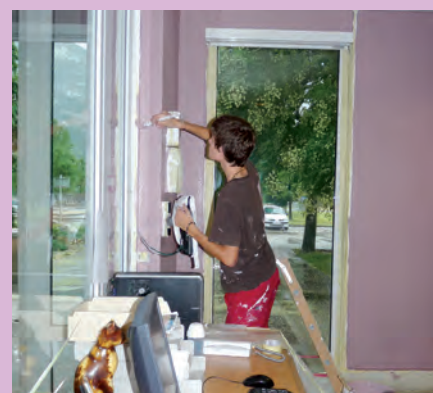
▲ Chantier jeunes du 11 au 13 juillet au centre technique municipal

A u mois de juillet, la météo n'a pas empêché les 32 jeunes sélectionnés pour les chantiers jeunes de s'investir ; chacun durant une semaine de vingt heures. Douze demoiselles et vingt garçons ont été encadrés par le responsable du service et ont œuvré à la mise en valeur des équipements