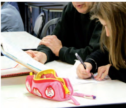
▲ Le soutien scolaire, une aide efficace

L'Espace jeunesse, c'est d'abord un lieu d'accueil, de rencontres et d'échanges, où sont présents trois animateurs et un responsable, tous quatre à l'écoute des jeunes et de leurs parents. Le centre de loisirs occupe près de 200 adolescents de 11 à 17 ans chaque année. Un programme est mis en place, composé d'activités séduisantes et dépaysantes : laser-game, sports de neige, randonnée, escalade, chiens de traîneau, via ferrata, karting, sortie au Futuroscope, squash, cinéma, bowling... La liste est longue et non exhaustive ! Les activités sont proposées à la journée ou à la demi-journée tout au long de l'année, les mercredis et les samedis en dehors des vacances scolaires, et lors de chaque période de vacances scolaires (hiver, printemps, été, Toussaint et Noël)