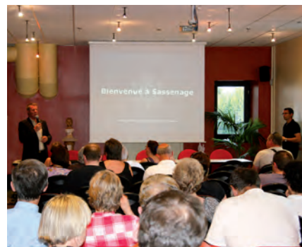
▲ Le maire a présenté la ville

Si les nouveaux arrivants n'étaient effectivement pas très nombreux — une cinquantaine —, leurs questions, elles, étaient légion : préoccupations du quotidien, interrogations sur les grands dossiers... Tout était bon dans les discussions !