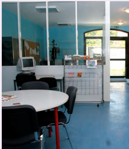
▲ Le Pij et la salle d'activités fraîchement repeints lors des chantiers jeunes de l'été

enfance éducation, Espace Familles, et maintenant jeunesse, pour simplifier les démarches des usagers. Désormais, ils trouveront toutes les activités au même endroit. Et ceci, alors même que le projet d'un guichet unique est en train de germer afin de rendre les inscriptions à ces services encore plus simples. « S'il voit le jour, il permettra un accueil unique pour tous les services à la population. Mais en parler aujourd'hui est prématuré , précise la directrice générale adjointe des services à la population. En attendant, le