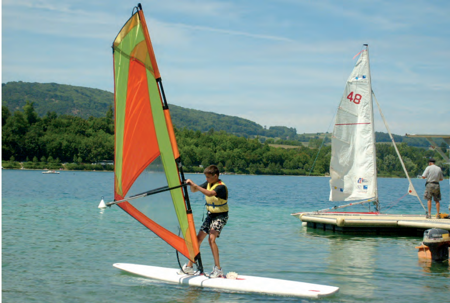
▲ De nombreuses activités sont proposées à la journée ou la demi-journée