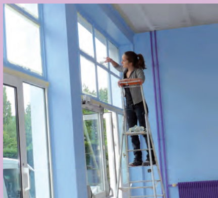
▲ Chantier jeunes du 18 au 21 juillet à l'école Vercors Guâ

boiseries, et même de petits meubles, qui ont été effectués. Ils ont manié le pinceau avec entrain et bonne humeur en contrepartie d'une rémunération bien méritée. Depuis le début de l'année, ce sont 47 adolescents de 17 ans qui ont participé à un chantier jeunes. Pour clore le