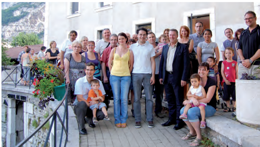
▲ Les nouveaux habitants se sont retrouvés en mairie le 28 juin

Entre information et décontraction, le courant est bien passé !