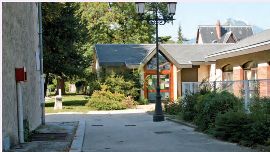
▲ L'Espace jeunesse se situe entre le conservatoire et le bâtiment des services à la population

D epuis le 1 er août, tous les services de la jeunesse sont regroupés sous une seule et même entité et dans un même lieu, l'Espace jeunesse. Situé entre le CCAS et le conservatoire de musique, il offre des possibilités plus intéressantes.