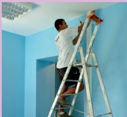
▲ Chantier jeunes du 4 au 8 juillet à l'Espace jeunesse