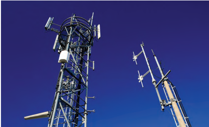
▲ Le maire a opposé un refus d'implantation de l'antenne relais à Rivoire de la Dame