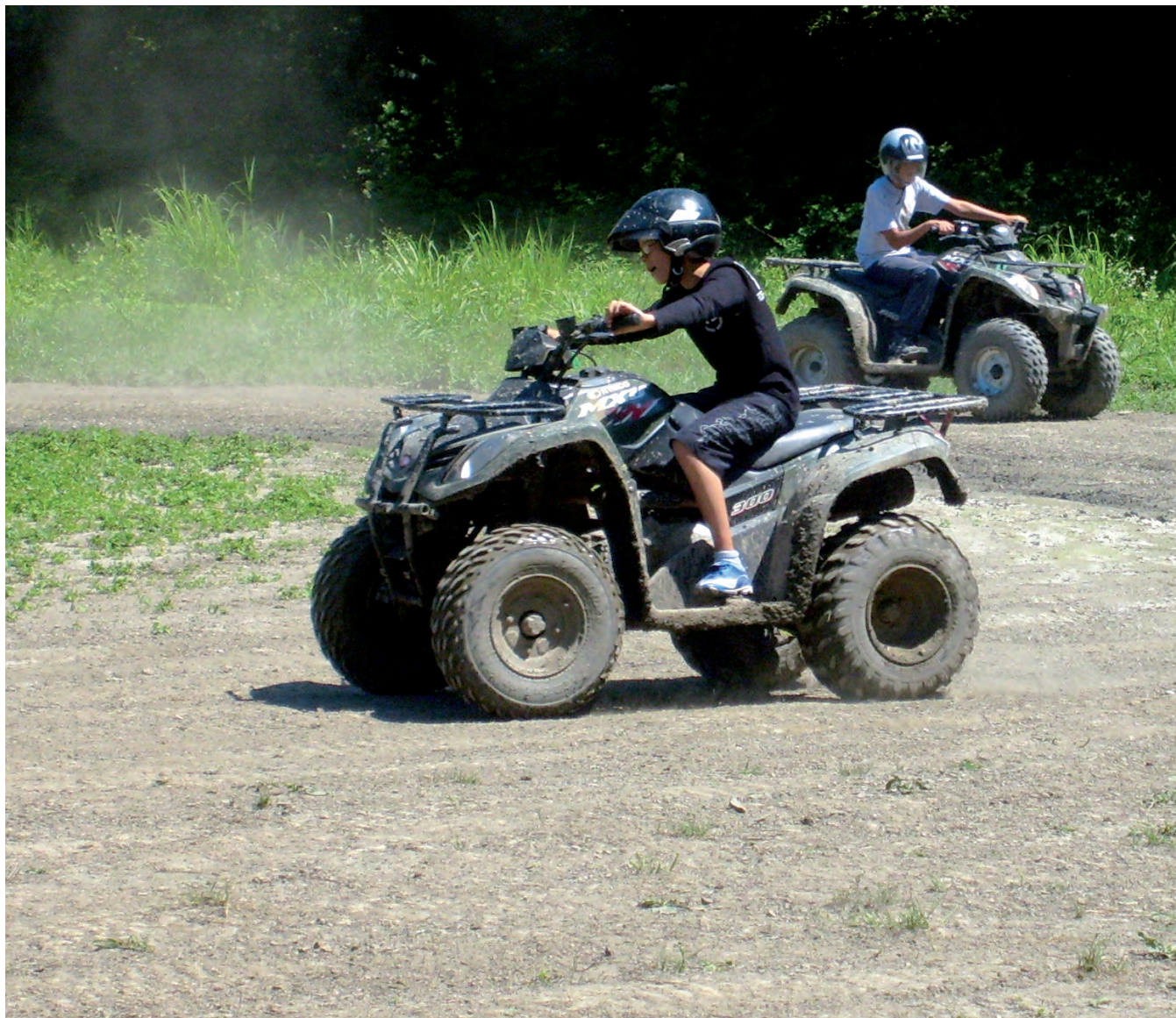
▲ Des activités variées sont proposées par le service jeunesse pour répondre aux attentes des 11-17 ans

La jeunesse, pierre angulaire de la société, est une préoccupation majeure sur le plan national, qui se construit à l'échelon local. Elle nécessite donc une attention de tous les instants. Pour améliorer la politique de la Ville en direction de cette population très en demande, plusieurs dispositifs ont été mis en place. En 2011, le Forum job d'été et orientation professionnelle a impliqué plus de 200 personnes, quand plus d'une