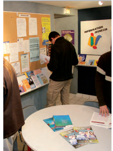
▲ Le point info jeunes

Trouver des renseignements concernant le logement, la formation, l'orientation, les métiers, la recherche d'un emploi ou d'un stage, les études ou le travail à l'étranger, les différentes bourses, et même un projet de vacances, est presque un jeu d'enfant grâce au Point info jeunes. Il propose tous types d'informations pour simplifier les recherches des jeunes. De nombreux classeurs mis à jour sont à leur disposition, accompagnés de brochures, de fiches... En outre, les professionnels présents sur place offrent leur aide pour se documenter efficacement. Un jeune souhaite partir à l'étranger ? Le pij peut l'aider à construire et affiner son projet. Une recherche d'emploi ? Une aide à la réalisation du CV, à l'orientation professionnelle ? La personne est dirigée