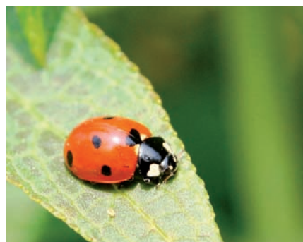
▲ Les coccinelles repoussent d'autres insectes

La mise en pratique de ces bons conseils était pour le lendemain ! Un atelier jardinage, toujours animé par Brin d'Grelinette, avait lieu à l'école maternelle du Hameau du Château samedi 31 mars, sous le regard attentif des jardiniers amateurs sassenageois. ■