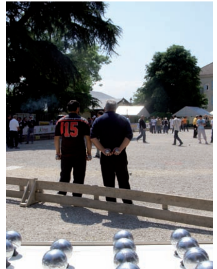
▲ Le carré d'honneur, parc Sasso Marconi, lors de l'édition 2011

« Que ce soit pour l'International ou pour le championnat de France à venir, Sassenage va accueillir plusieurs milliers de joueurs, accompagnateurs et spectateurs qui n'auraient sans doute pas fait le déplacement dans la banlieue grenobloise. Pour Sassenage, c'est une chance à saisir