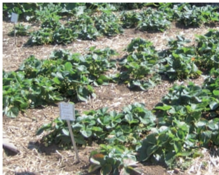
▲ Jardiner sans polluer