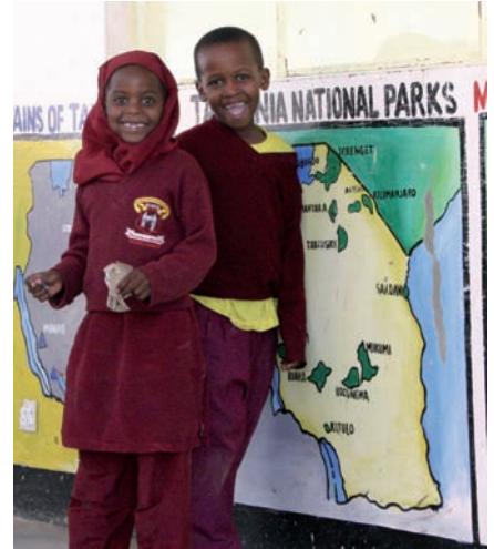
▲ Enfants de l'école d'Arusha

Connaissant les risques pour les porteurs, qui sont amenés à porter plus de quinze kilos chacun durant la montée, Laurent a tenu à leur faire un don via une ONG (2) locale, et grâce à l'aide de ses sponsors, c'est une vingtaine de kilos de vêtements (vestes, polaires...) qui leur a été remise. Il a aussi tenu à faire un geste pour une