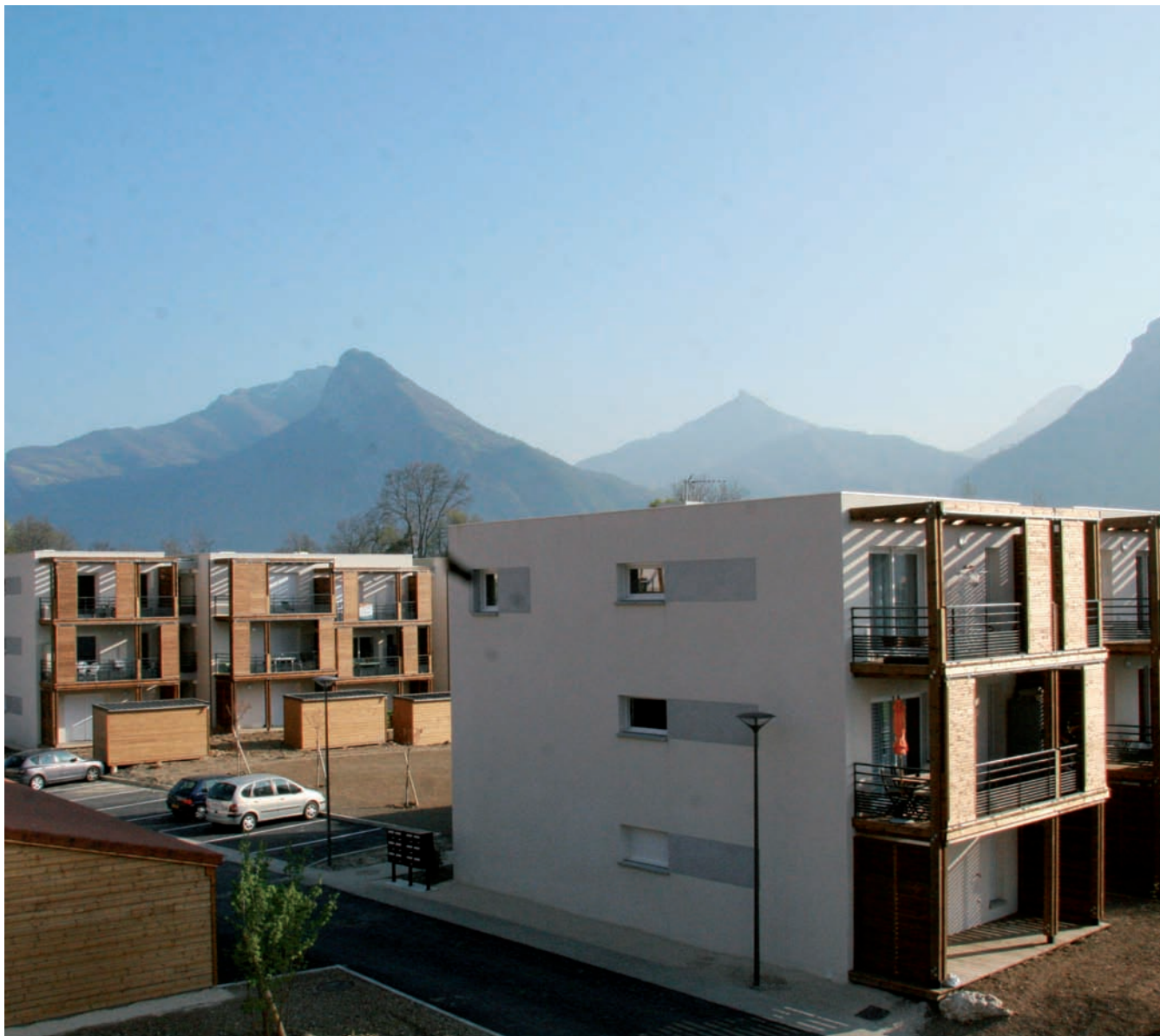
▲ Le Parc des Enginières, un programme salué pour la qualité de ses prestations

Chacun rêve de trouver LE logement, bien situé, proche des commerces, de l'école et de toutes les commodités, desservi par les transports en commun... Sauf que la réalité s'apparente souvent à un parcours du combattant, ou encore à la quête du Graal, bref, la recherche s'avère moins évidente en pratique qu'en théorie.