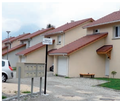
Impasse Frédéric Chopin