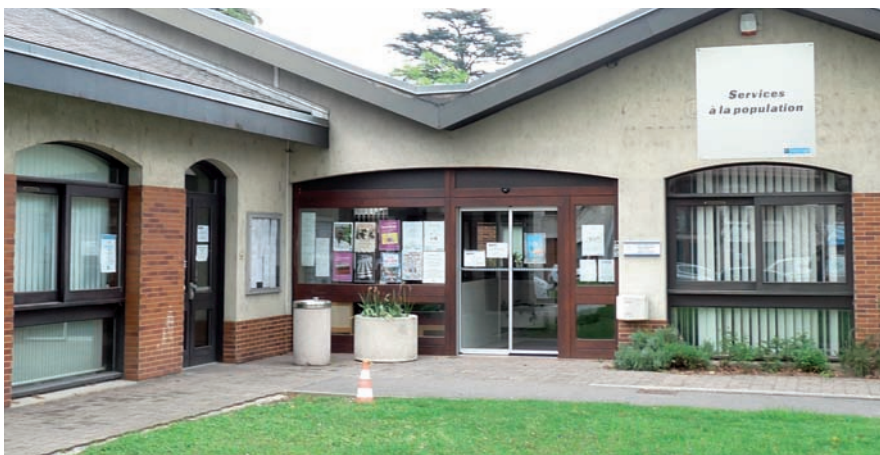
▲ C'est dans les locaux des services à la population que se tiendra le guichet unique

Le Pôle Famille Enfance Education, situé 1