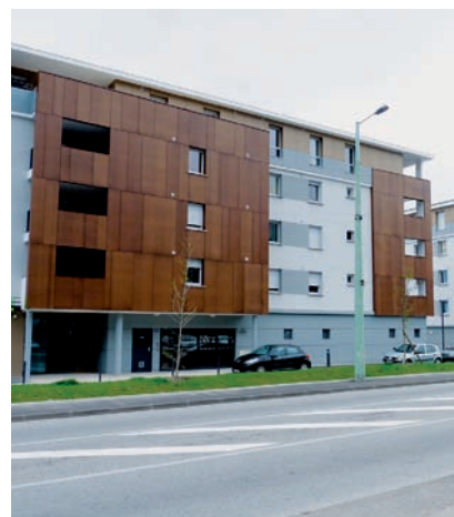
12 et 14 avenue de Romans Livré en 2011