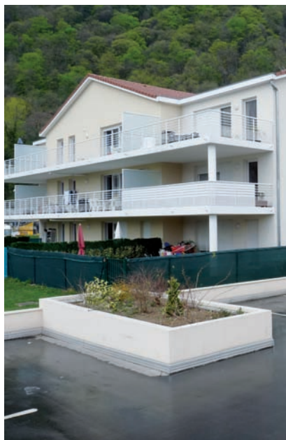
Rue du Pré du Bourg Livré en 2010