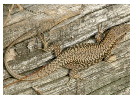
▲ Les lézards, insecticides naturels

Infos : mission environnement et développement durable de la Ville, 04 76 26 72 71 ou environnement@sassenage.fr ou www.brindgre.org.