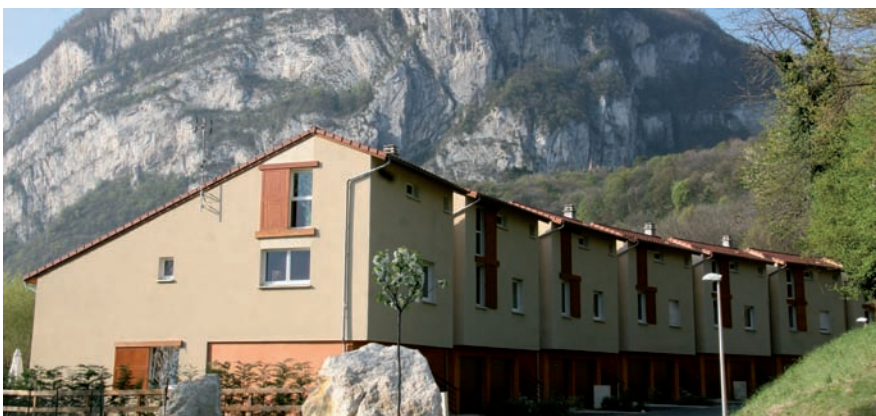
▲ Le Hameau de Présine, un programme qui intègre avec succès de l'habitat social et privé

Le premier axe du PLH tend à développer la production de logements pour tous et de manière mieux répartie sur le territoire des