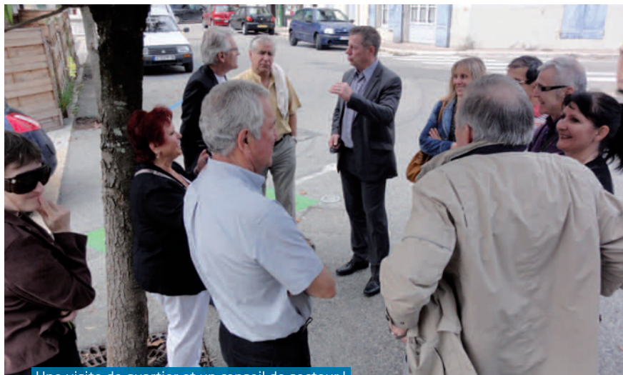
Une visite de quartier et un conseil de secteur !

S amedi 8 juin, c'était une visite de quartier un peu particulière qui avait lieu puisqu'elle était couplée à une réunion du conseil de secteur Centre. Entre autres points abordés, des riverains se