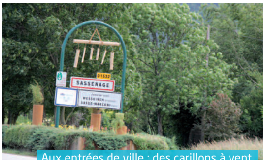
Aux entrées de ville : des carillons à vent

Une invitation à la flânerie et à la méditation pour un été zen !