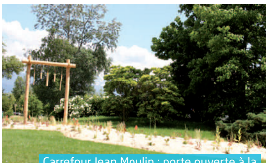
Carrefour Jean Moulin : porte ouverte à la méditation