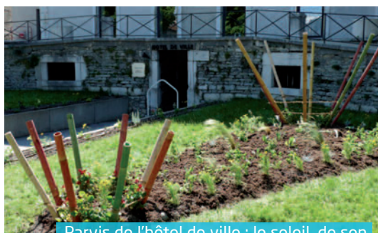
Parvis de l'hôtel de ville : le soleil, de son lever à son zénith