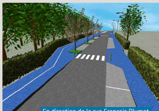
En direction de la rue François Blumet

Le maire estime préférable de transférer la dépose et la reprise des élèves à l'arrière de la halle Jeannie Longo, afin d'éviter la gêne occasionnée par le stationnement du bus côté rue. Ce déplacement permettrait également de sécuriser la desserte.