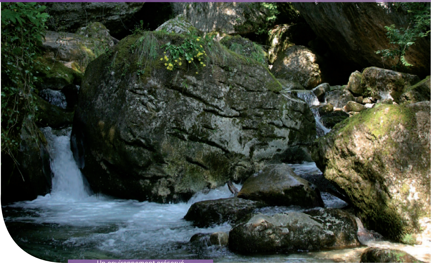
Un environnement préservé