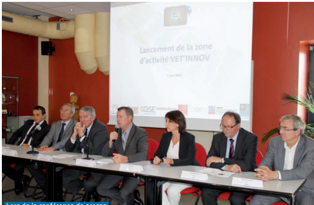
Lors de la conférence de presse

Passage de 18 à 100 salariés dès l'année prochaine, 400 à terme (4-5 mois) sur toute la zone