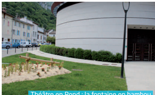
Théâtre en Rond : la fontaine en bambou