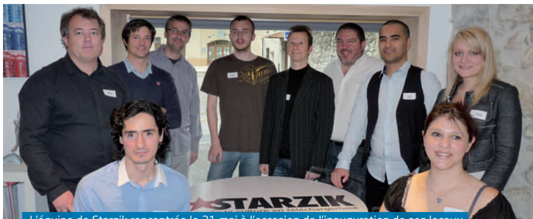
L'équipe de Starzik rencontrée le 31 mai à l'occasion de l'inauguration de ses locaux