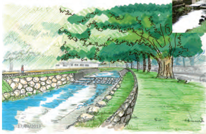
Plage de dégravement