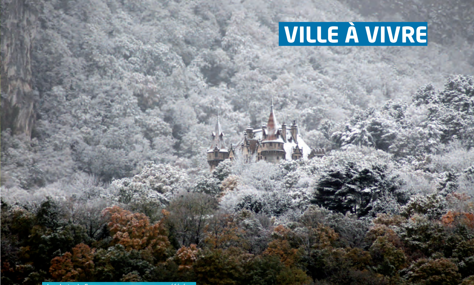
La photo de Sassenage que vous avez préférée