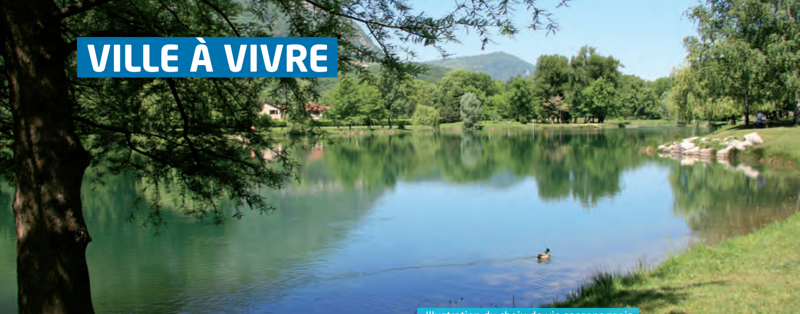
Illustration du choix de vie sassenageois