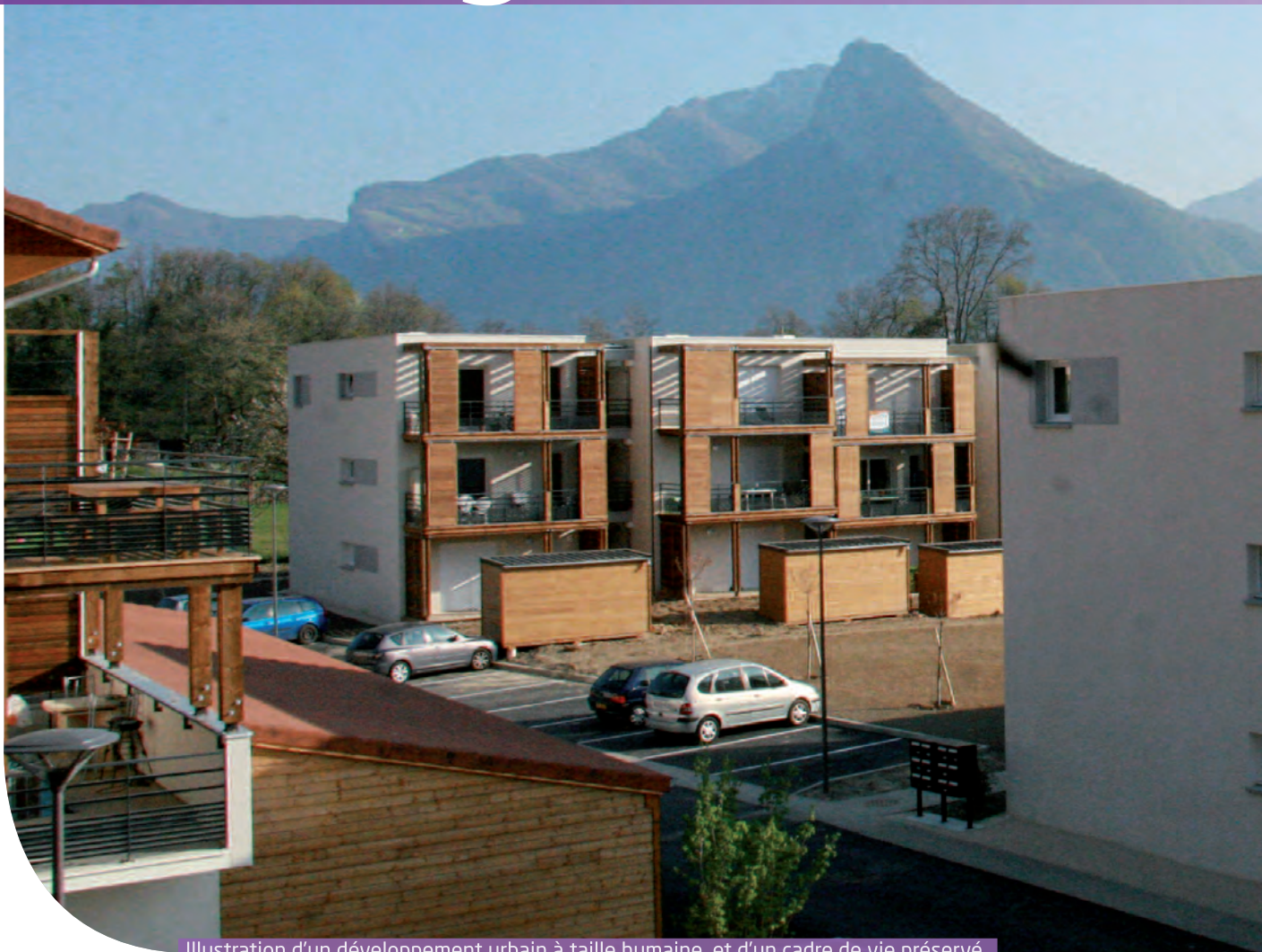
Illustration d'un développement urbain à taille humaine, et d'un cadre de vie préservé

a vec un peu plus de 10 % de logements sociaux, Sassenage est loin du seuil des 25 % fixé par la loi SRU (loi relative à la solidarité et au renouvellement urbain), mais partant d'un taux de 6,60 % en 2001, la progression est bel et bien là, et appelée à se poursuivre.