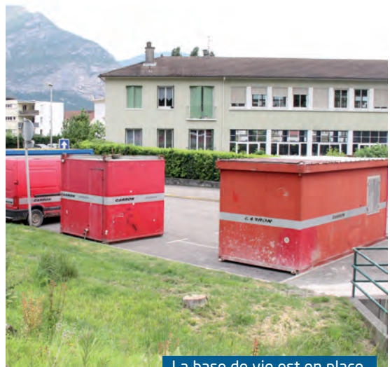
La base de vie est en place

3) La déconstruction et la reconstruction des digues interviendront entre la passerelle du lavoir et la confluence avec le canal de la petite Saône. Des aménagements de surface, paysagers, et l'amélioration de l'éclairage seront réalisés, le tout s'étalant jusqu'en 2017... ●