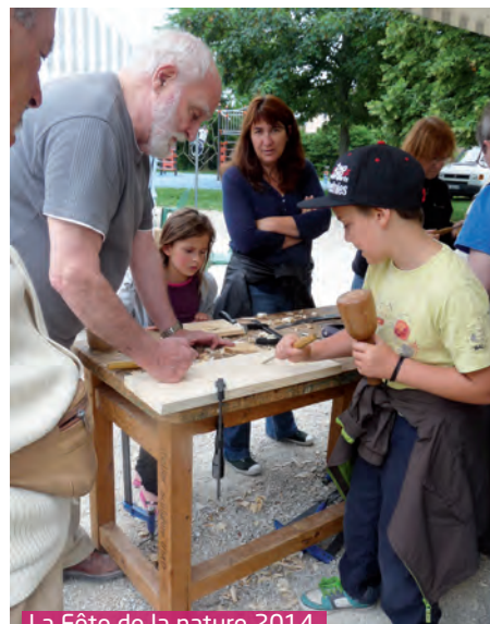
La Fête de la nature 2014

Rendez-vous est pris dimanche 4 octobre avec la nature ! ●