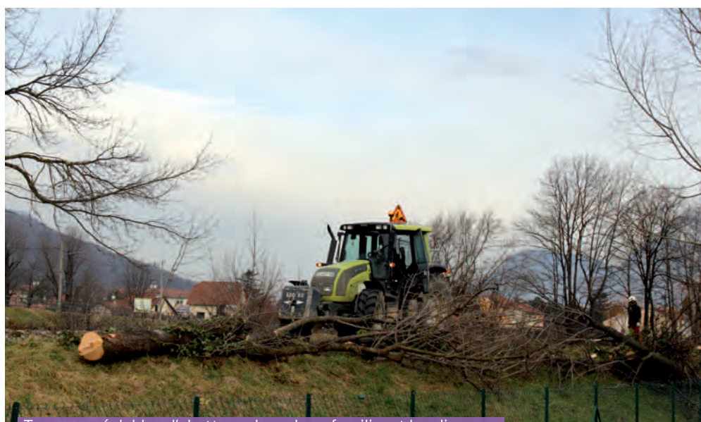
Travaux préalables d'abattage des arbres fragilisant les digues