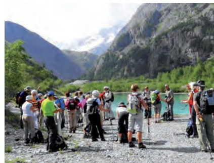
(1) gymnastique, yoga, country, acti-marche, randonnée pédestre

Bravo donc à cette association qui bouge pour vous faire bouger ! ●