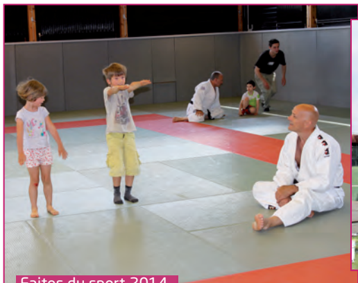
Faites du sport 2014