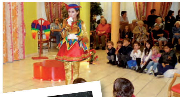
Le Noël de l'éhpap