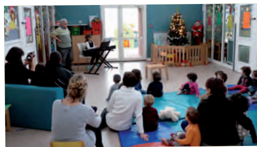
Mini-concert au multi-accueil