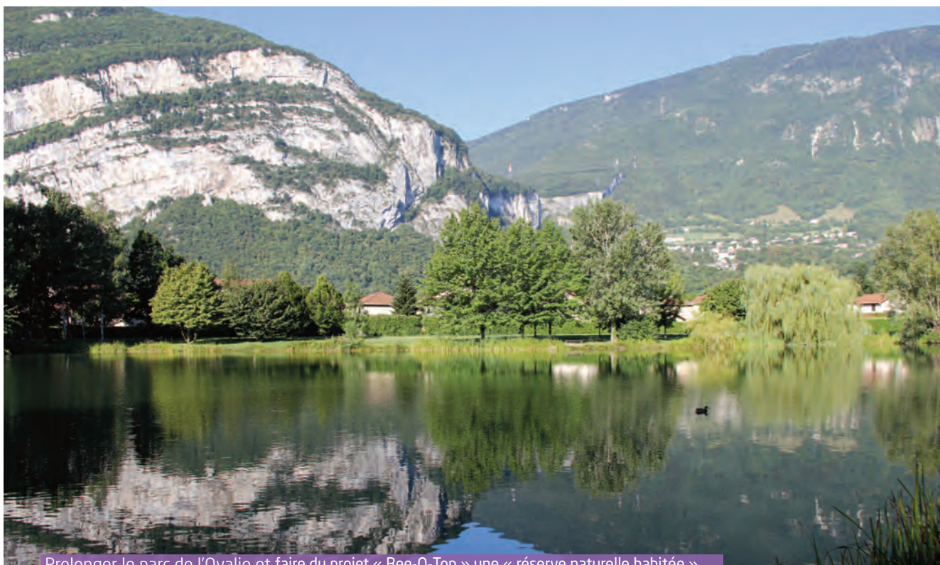
Prolonger le parc de l'Ovalie et faire du projet « Bee-O-Top » une « réserve naturelle habitée »

Créer des espaces extérieurs de rencontre et de partage pour favoriser le lien social de proximité