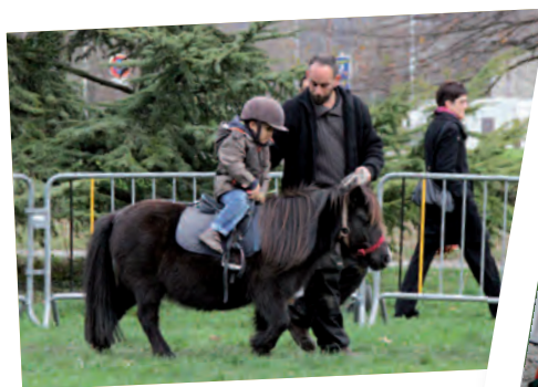
Grand jeu de Noël