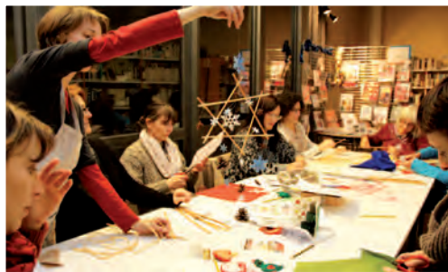
Atelier de décorations de Noël à l'Ellipse