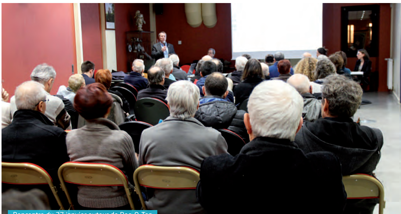
Rencontre du 27 janvier autour de Bee-O-Top

en locatif social (deux bâtiments en R+3 et R+4)