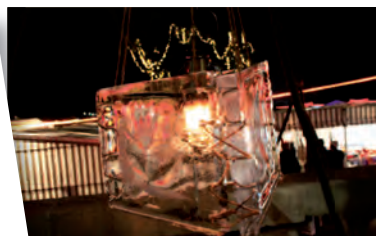
Marché de Noël