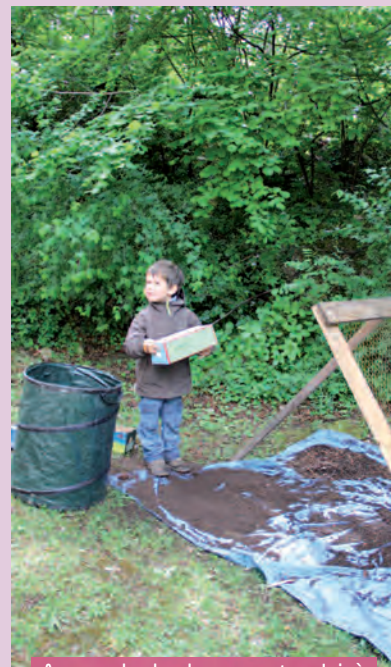
Apprendre les bons gestes. Ici, à Rivoire de la Dame en mai 2014

INFOS ET INSCRIPTIONS : ASSOCIATION TRIÈVES COMPOSTAGE & ENVIRONNEMENT, 04 76 34 74 85 OU TRIÈVES-COMPOSTAGE@HOTMAIL.COM.