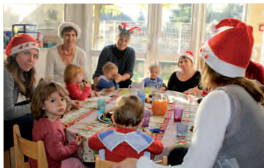
Goûter au Ram