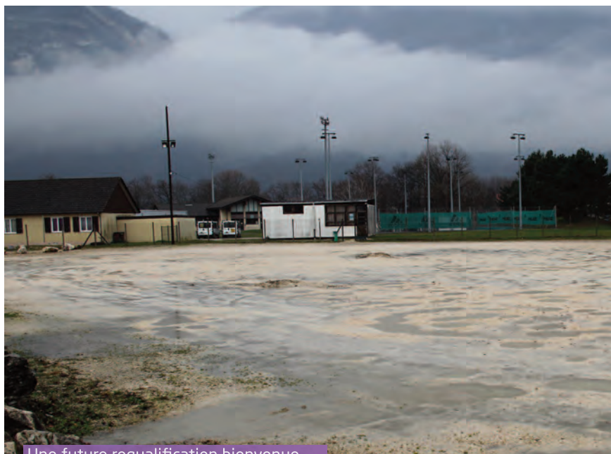
Une future requalification bienvenue...

Les abeilles y trouveront assurément leur bonheur, et pas seulement elles !