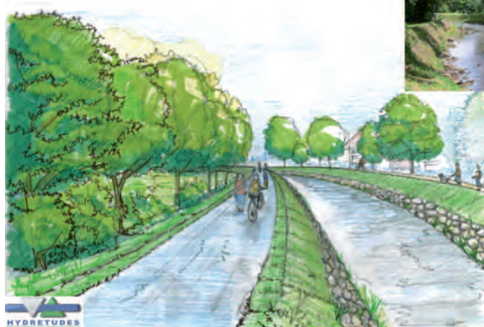
Tronçon aval de la RD1532