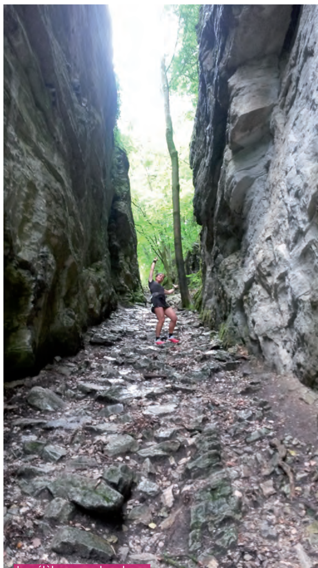
Le célèbre coup du sabre

INFOS ET INSCRIPTIONS : ACS, JEAN-PATRICK BOLF, 06 72 70 07 04 ET WWW.ACSASSENAGE.FR . TARIFS 10 KM : 10 € EN PRÉ-VENTE, ET 12 € SUR PLACE. TARIFS : 20 KM : 12 € EN PRÉ-VENTE ET 14 € SUR PLACE.