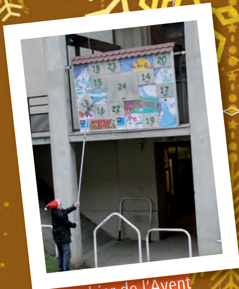
Calendrier de l'Avent