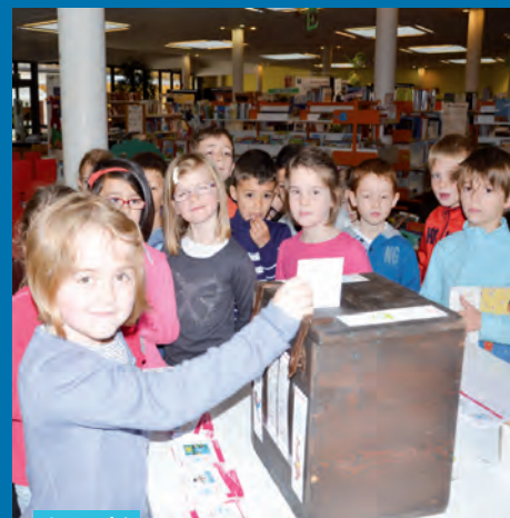
A voté !

Le moins que l'on puisse dire, c'est que le hasard fait bien les choses !