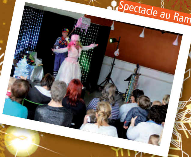
Spectacle au Ram