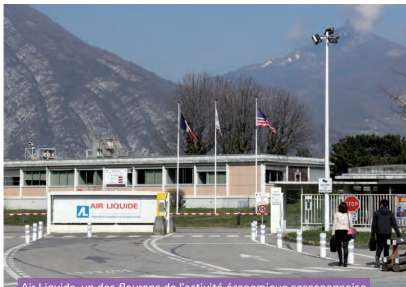
Air Liquide, un des fleurons de l'activité économique sassenageoise