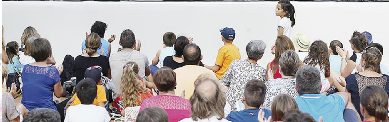
Jam - Session Photo