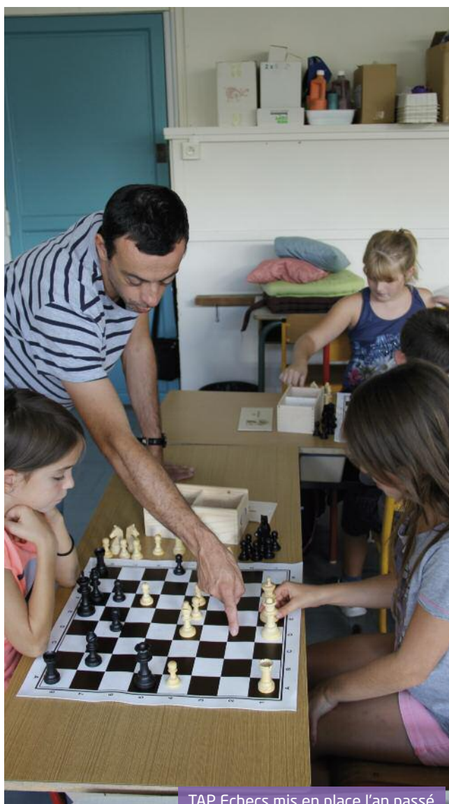
TAP Echecs mis en place l'an passé

- une le lundi et deux le jeudi (en fonction des inscriptions) à Vercors et au Hameau du Château ●