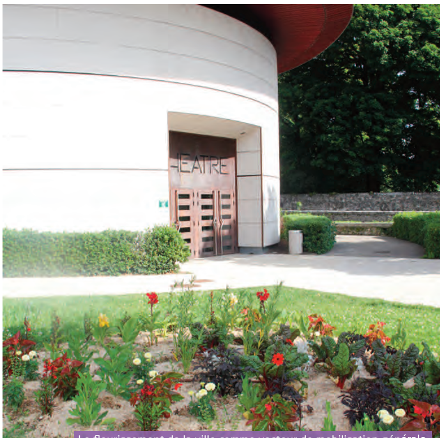
Le fleurissement de la ville comme vecteur de mobilisation générale