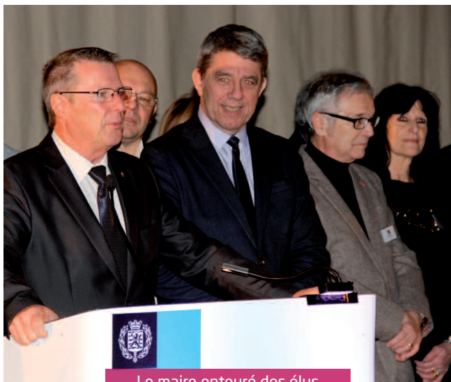
Le maire entouré des élus

« Plaisir et émotion de vous retrouver en ce moment privilégié de partage, de rencontre, de convivialité et d'amitié avec vous tous ».