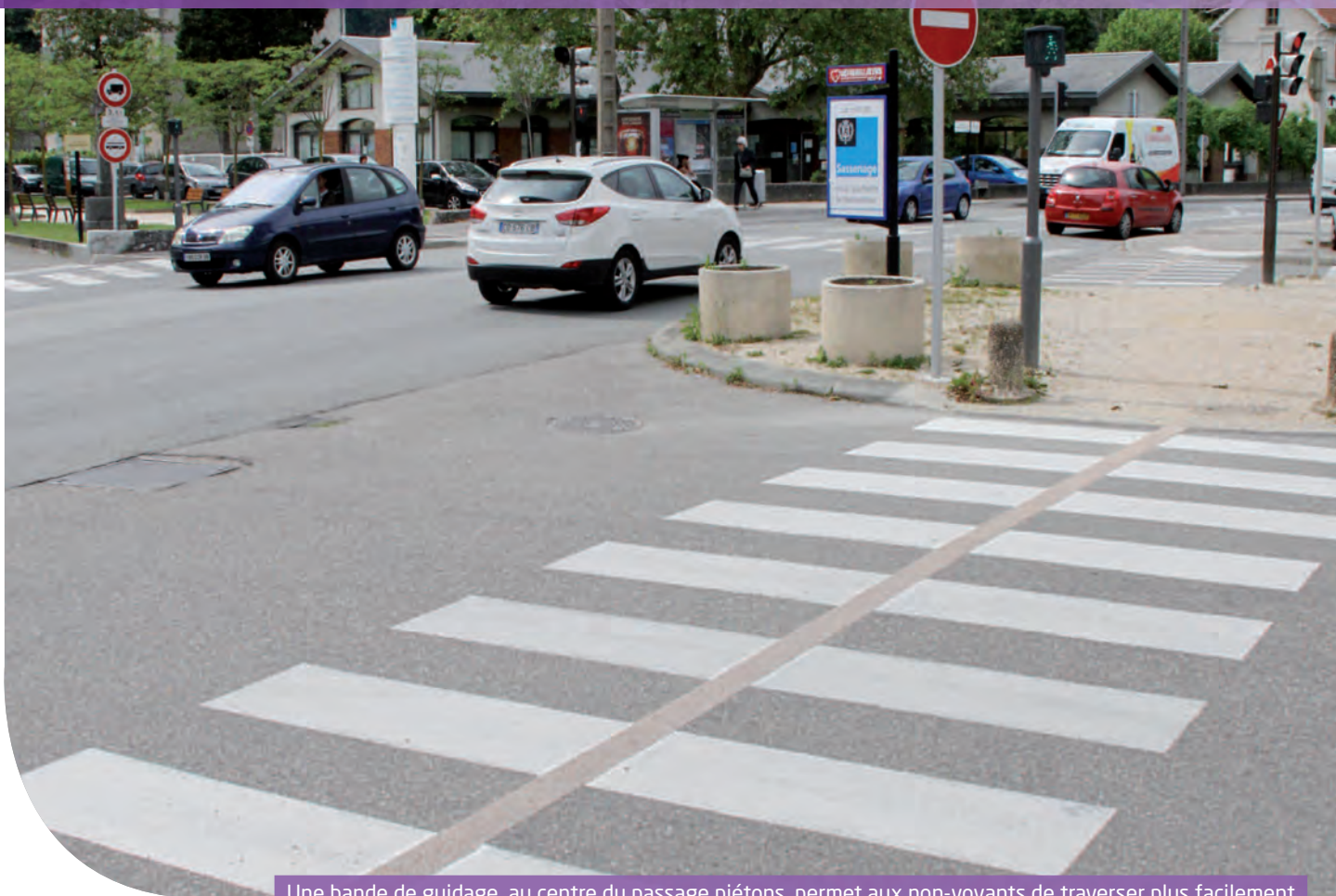
Une bande de guidage, au centre du passage piétons, permet aux non-voyants de traverser plus facilement

La loi du 11 février 2005 pour l'égalité des droits et des chances, la participation et la citoyenneté des personnes handicapées, prévoyait la mise en accessibilité de tous les établissements recevant du public (ERP) (1) et installations ouvertes au public (IOP) (2) au 1 er janvier 2015. Mais à la date butoir, seuls 40 % des locaux concernés étaient finalement aménagés.