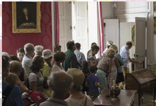
Jam - Session Photo