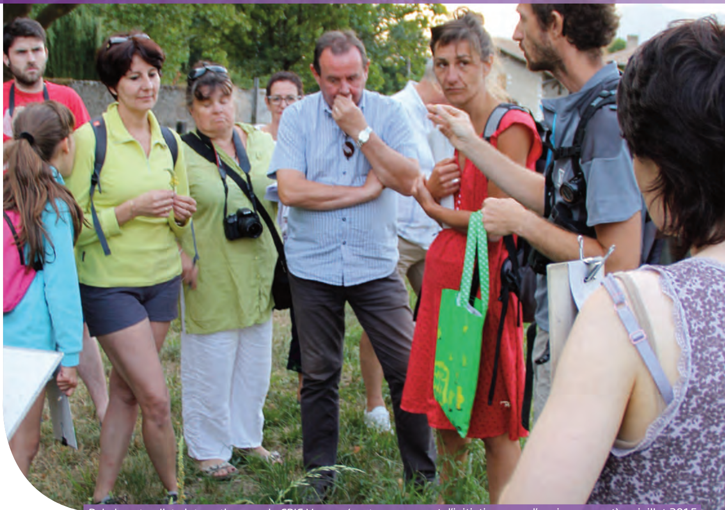
Balade naturaliste interactive avec le CPIE Vercors (centre permanent d'initiatives pour l'environnement) en juillet 2015

« Choisir une action, dans le périmètre de leurs délégations respectives et dans un champ temporel allant de la mémoire récente au futur proche », tel était le défi lancé aux adjoints (1) de la Ville pour illustrer leur implication en matière de développement durable.