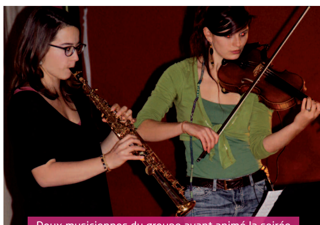
Deux musiciennes du groupe ayant animé la soirée

Que vous soyez comblés et qu'il en soit de même pour tous ceux qui vous sont chers, tout au long de l'année, y compris le 366 ème jour de cette année car 2016 nous offre un jour de plus de bonheur, santé et autres beaux et heureux moments... Profitons-en, profitons de chaque instant ! »