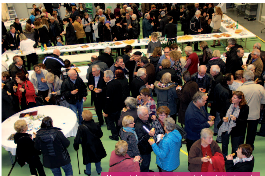
Moment de partage autour de la galette des rois