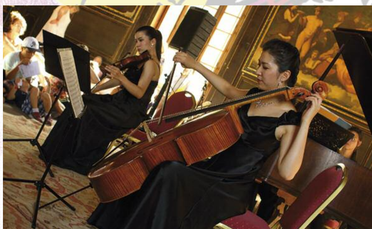
Jam - Session Photo