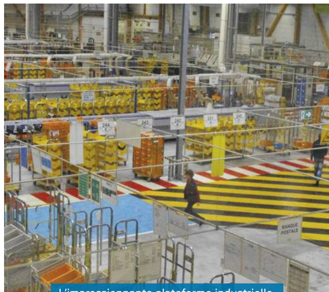
L'impressionnante plateforme industrielle

Artisans, commerçants, entrepreneurs et représentants associatifs disposent d'un espace de vente dédié qui leur permet de gagner du temps. Les services proposés (boîtes postales individualisées, envoi de courriers et colis, achat d'enveloppes prêts à poster, d'emballages colis et de timbres...) visent en effet à simplifier la gestion quotidienne de leur courrier. Ces mêmes clients pro peuvent aussi