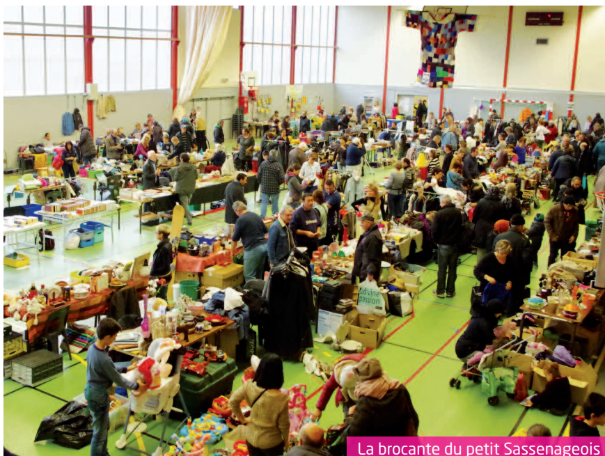
La brocante du petit Sassenageois

Le lendemain, samedi 5 décembre, place, dans un premier temps, au vide-grenier. La présidente d'Espoir Sassenage précise : « Globalement, il y a eu beaucoup plus de monde le matin que l'après-midi. Du coup,