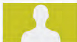
Et pourquoi pas vous ! Vous êtes peut-être le prochain #GOHEROES !

SUIVEZ NOS #GOHEROES ET PARTAGEZ VOS CONTENUS AVEC LE HASHTAG SUR LES RESEAUX SOCIAUX :