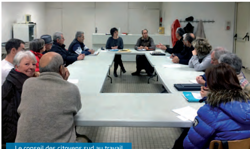
Le conseil des citoyens sud au travail

Après un retour sur les demandes formulées lors du dernier conseil des citoyens, les