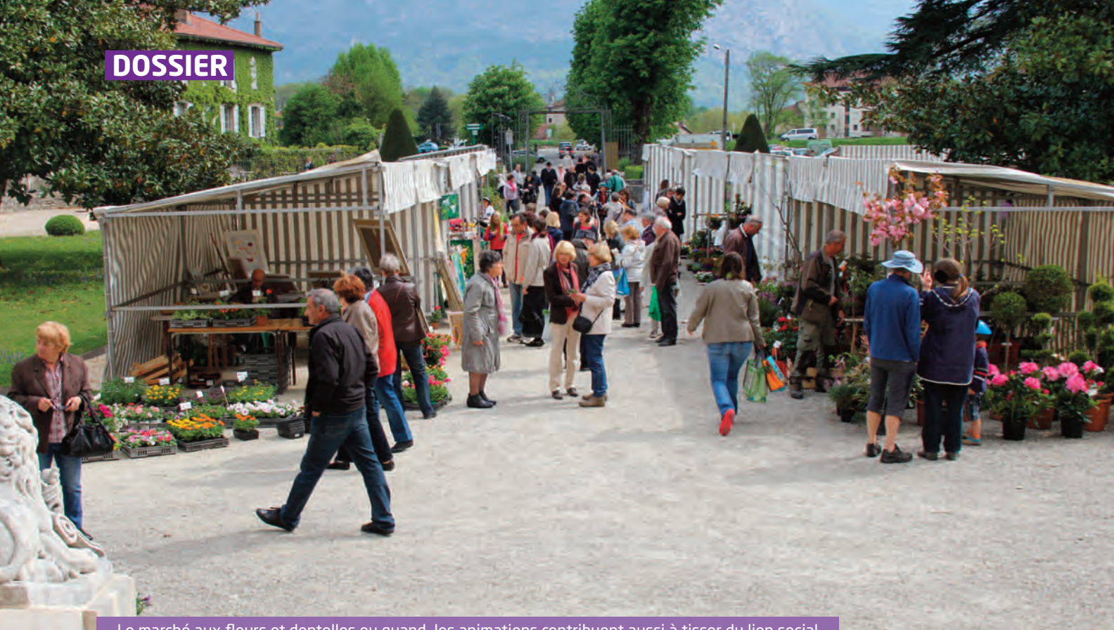
Le marché aux fleurs et dentelles ou quand les animations contribuent aussi à tisser du lien social