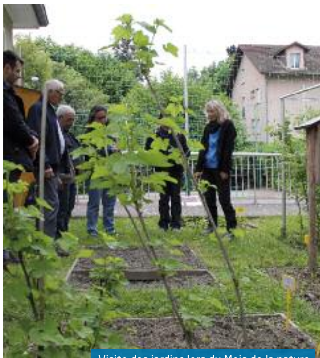
Visite des jardins lors du Mois de la nature

ENS est en outre partenaire de la Ville en matière d'éducation et de sensibilisation à l'environnement auprès des enfants sassenageois. Une convention a été signée pour formaliser cette collaboration étroite, et la subvention de fonctionnement que la Ville verse à l'association est d'ailleurs affectée majoritairement à la mise en œuvre des projets pédagogiques des écoles portant sur une thématique environnementale.