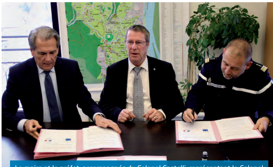
Le maire et le préfet, accompagnés du Colonel Castelli, représentant le Colonel commandant le groupement de gendarmerie départemental de l'Isère

L'armement de la police municipale a également été abordé. Et si les agents communaux ont exprimé le souhait d'être