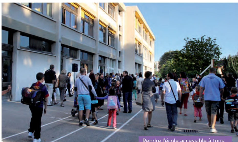
Rendre l'école accessible à tous...

les établissements communaux recevant du public