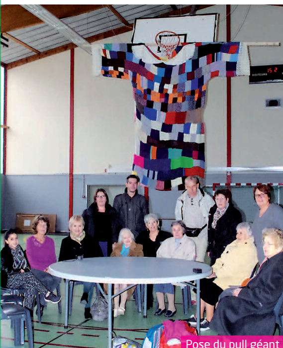
Pose du pull géant

L'association Espoir Sassenage remercie tous ceux qui se sont impliqués de près ou de loin, ainsi que les associations sassenageoises qui ont bien voulu lui prêter main forte.