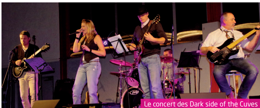
Le concert des Dark side of the Cuves