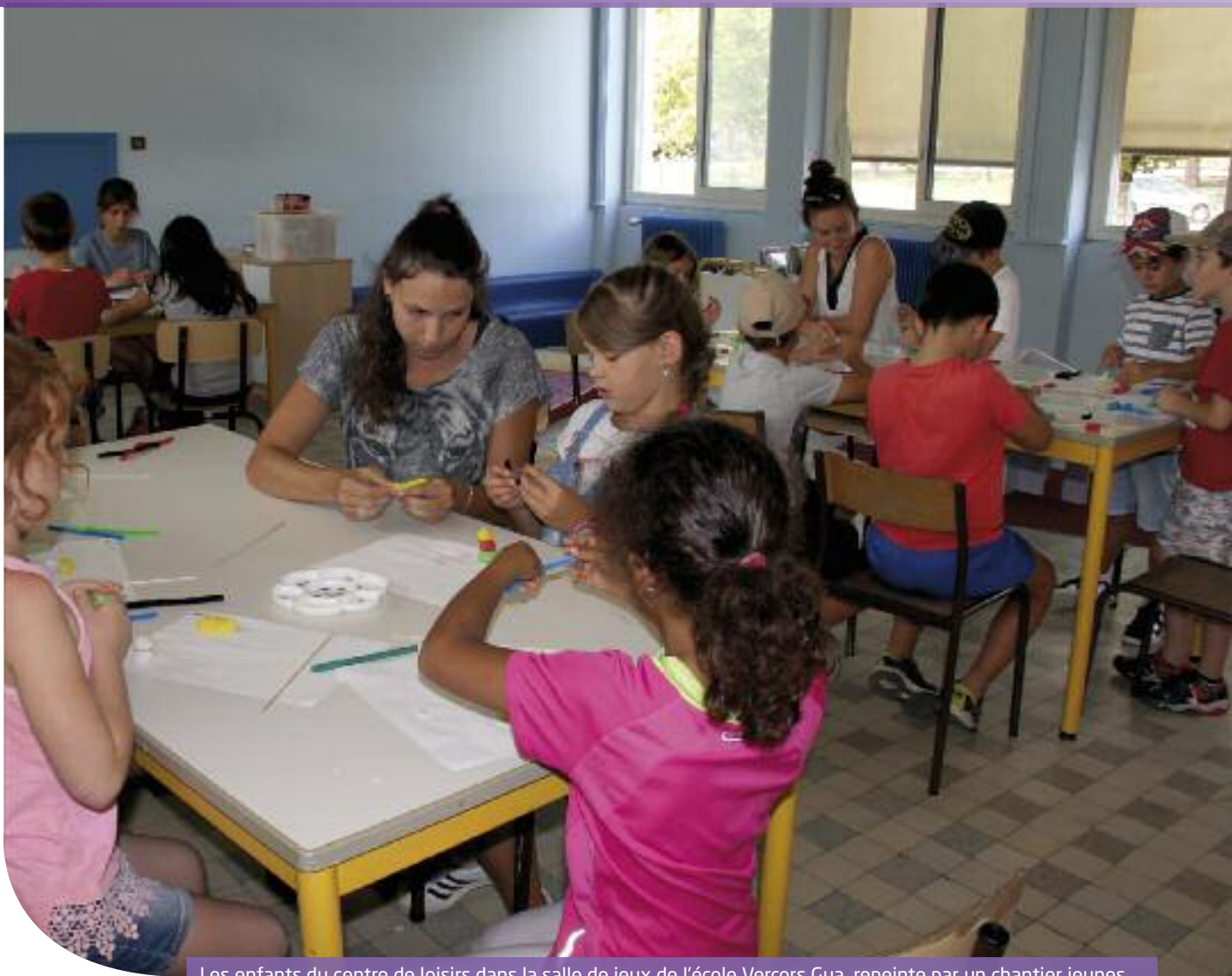
Les enfants du centre de loisirs dans la salle de jeux de l'école Vercors Gua, repeinte par un chantier jeunes

■ Il est de coutume de réaliser bon nombre de travaux pendant l'été. Deux mois au cours desquels les rues semblent moins encombrées par les véhicules, et davantage par les engins de travaux, et notamment ceux intervenant dans le cadre du vaste chantier de sécurisation et de valorisation des digues du Furon, porté par la Ville et l'association syndicale de Comboire à l'Echaillon. Avec le transfert au 1 er janvier 2016 de la compétence voirie à Grenoble Alpes Métropole, rappelons que ce n'est plus la Ville qui décide des temps d'intervention sur les chaussées communales. En tout cas, certains bâtiments communaux, dont les