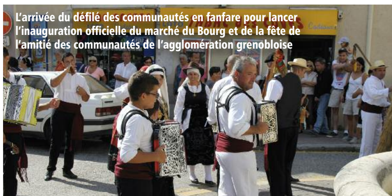
L'arrivée du défilé des communautés en fanfare pour lancer l'inauguration officielle du marché du Bourg et de la fête de l'amitié des communautés de l'agglomération grenobloise

Le marché du Bourg est amené à s'étoffer puisque d'autres commerçants (rôtisseur, producteur de viande de porc + laiterie de Chartreuse et un primeur bio) les rejoignent !