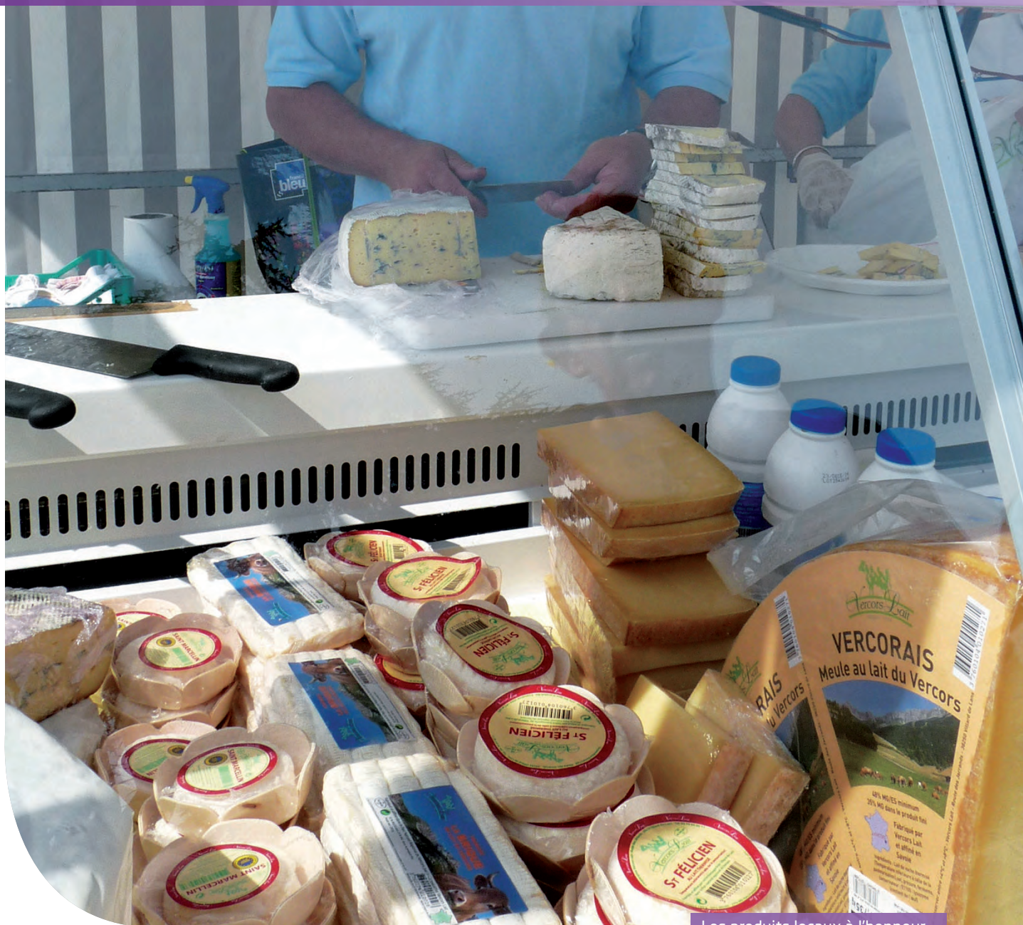
Les produits locaux à l'honneur...

e n effet, on aurait pu prendre le parti d'énoncer chiffres et autres données statistiques comme c'est de coutume de le faire quand il est question d'économie. Sauf que l'économie locale, c'est aussi et surtout le poulx d'une commune, le témoin de sa vitalité et de son dynamisme !