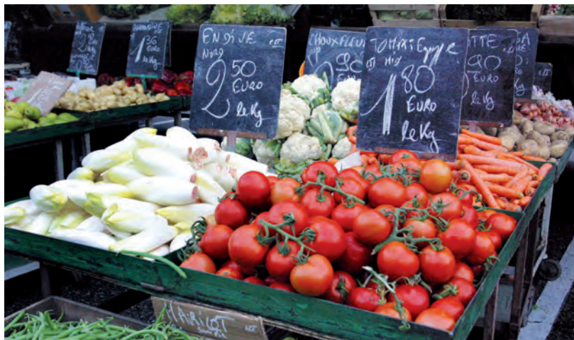
(1) lire, dans Sassenage en pages n°173 – été 2012, l'article « Le commerce et vous », rendant compte des résultats de cette consultation.

Enfin, cette démarche fait aussi écho aux résultats d'une consultation menée en 2012 via Sassenage en pages (1) et qui visait à mieux appréhender la perception des Sassenageois sur l'activité commerciale locale. ●