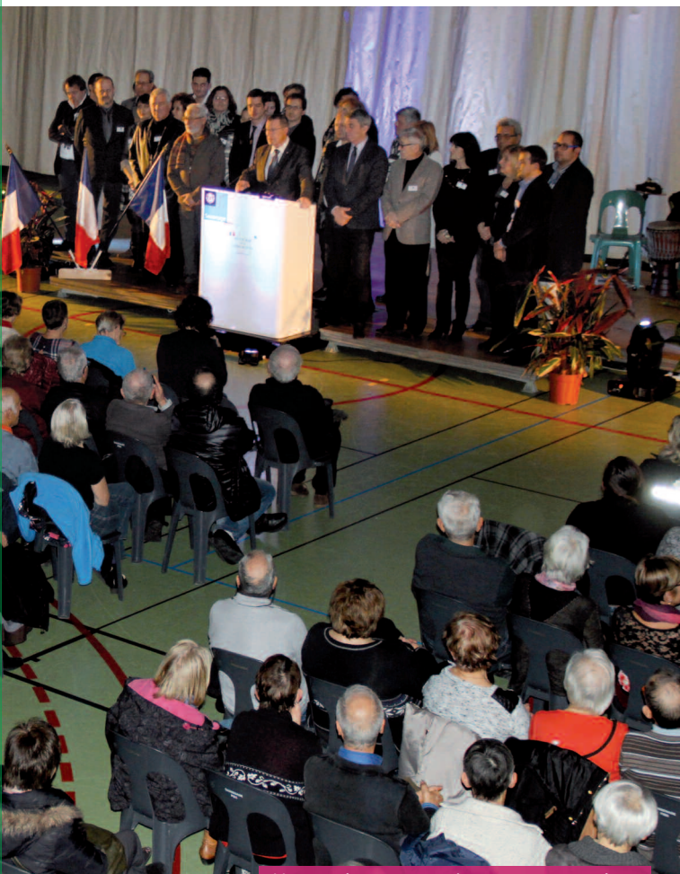
Une assistance nombreuse et attentive