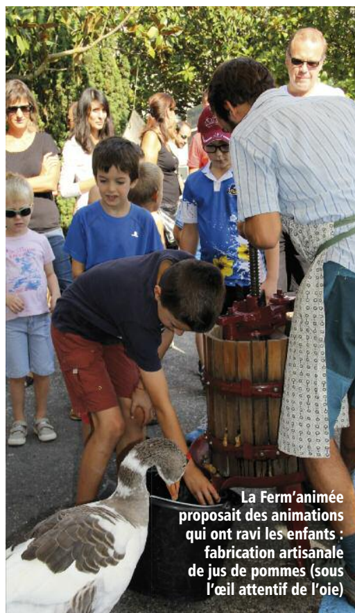
La Ferm'animée proposait des animations qui ont ravi les enfants : fabrication artisanale de jus de pommes (sous l'œil attentif de l'oie)