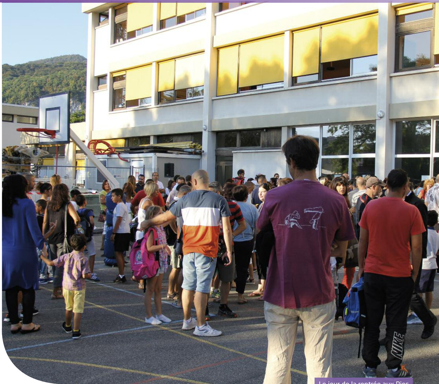
Le jour de la rentrée aux Pies