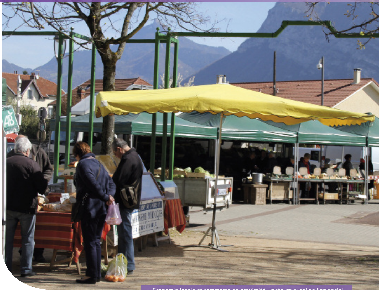
Economie locale et commerce de proximité, vecteurs aussi de lien social

Le développement économique figure au rang des compétences récemment transférées aux intercommunalités. Toutefois, il est resté à Sassenage une préoccupation majeure, illustrée notamment par l'élection d'un nouvel adjoint délégué à l'activité économique, au commerce et à l'artisanat, et par l'attention ainsi portée par l'équipe municipale à être un acteur clé de proximité en matière de vitalité économique, et par là même d'emploi.