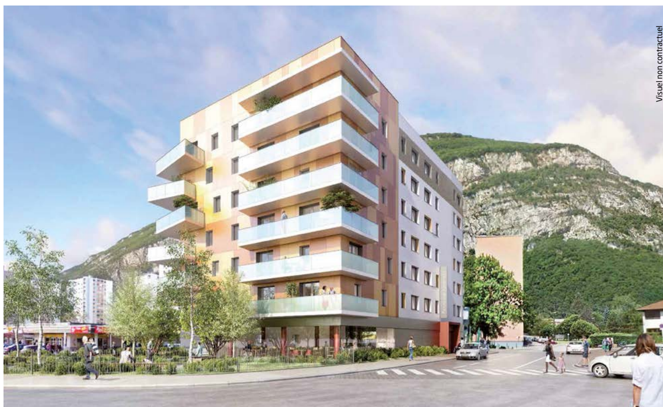
Visuel non contractuel

De nouveaux logements vont voir le jour à Sassenage. Il s'agit d'une résidence autonomie, un bâtiment entièrement dédié à l'habitat des seniors non dépendants. Lundi 19 novembre, le projet était présenté aux Sassenageois à l'occasion d'une réunion publique.