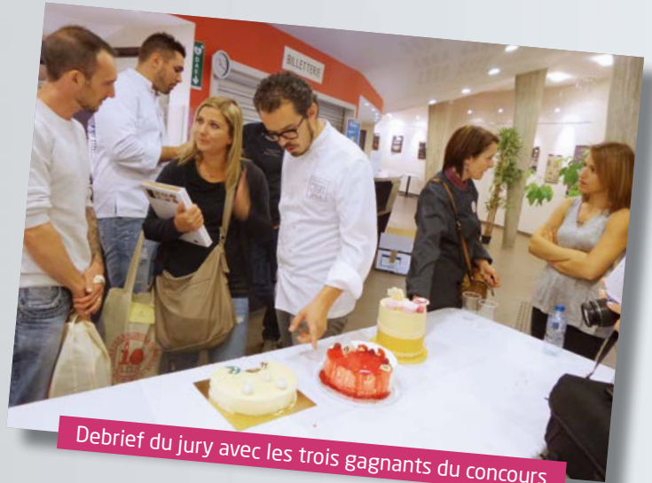
Debrief du jury avec les trois gagnants du concours