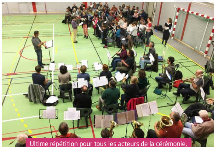
Ultime répétition pour tous les acteurs de la cérémonie, gymnase des Pies, mercredi 7 novembre