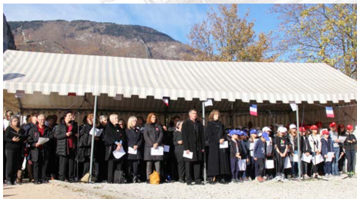
L'orchestre d'harmonie « L'Écho des Cuves » de Sassenage, les Chœurs de Sassenage, les Chœurs en fête, la chorale du collège Fleming, et les enfants des écoles élémentaires encadrés par les professeurs du CRC Alfred Gaillard de Sassenage ainsi que les enfants du périscolaire, tous réunis par le chant pour célébrer la Grande Guerre