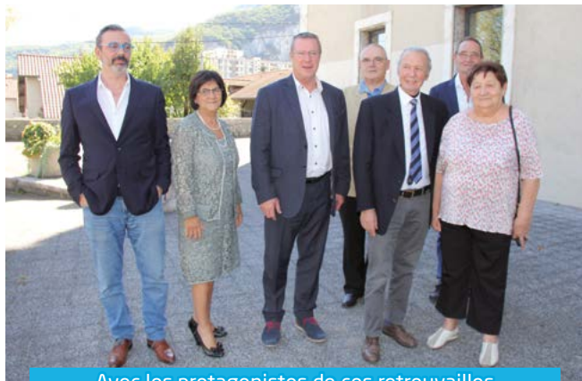
Avec les protagonistes de ces retrouvailles