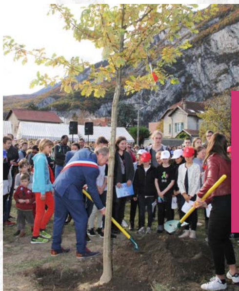
C'est un chêne, symbole de force, de longévité et de générosité, qui a été choisi pour être planté près du Monument aux morts, comme un signe de la puissante amitié franco-allemande qui perdure aujourd'hui, cent ans après la fin de la Première Guerre mondiale