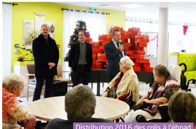
Distribution 2016 des colis à l'éhpad