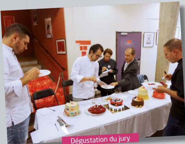
Dégustation du jury

Une journée placée sous le signe de la fête et de la gourmandise... Que rêver de mieux ! Samedi 29 septembre, le Théâtre en Rond célébrait les 60 ans de sa construction et les 10 ans de sa réouverture, faisant suite à l'incendie qui l'avait entièrement ravagé en 2004. Retour en images sur cette journée partagée avec des musiciens, des danseurs, des pâtissiers amateurs accompagnés d'un beau jury de connaisseurs, des gourmands, des curieux, des spectateurs... Et la liste n'est pas exhaustive ! A tous, un grand merci pour ce beau moment.