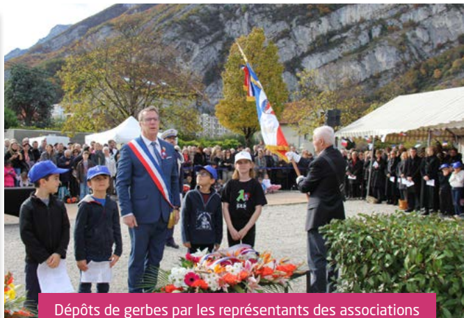
Dépôts de gerbes par les représentants des associations d'anciens combattants, puis par le maire accompagné de quatre écoliers