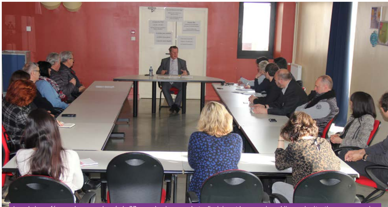
Lors de la conférence de presse donnée le 27 mars dernier pour alerter l'opinion et les pouvoirs publics sur la situation sassenageoise