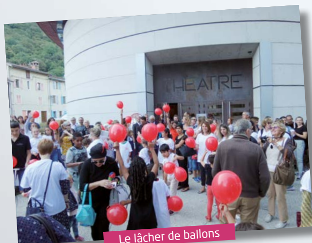
Le lâcher de ballons