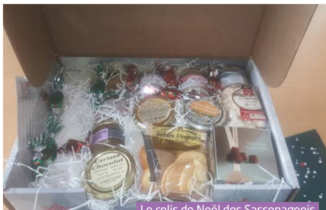
Le colis de Noël des Sassenageois

1080 colis distribués cette année, dont 80 pour l'éhpad 285 Sassenageois inscrits au repas de Noël du 5 décembre