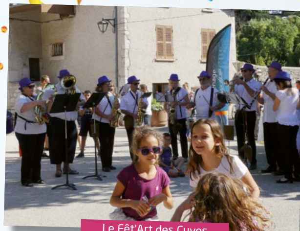
Le Fêt'Art des Cuves