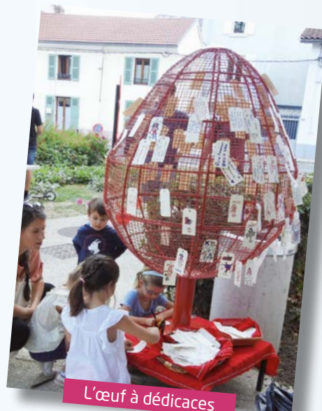
L'œuf à dédicaces