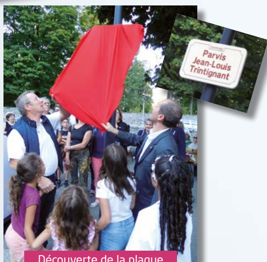
Découverte de la plaque Jean-Louis Trintignant