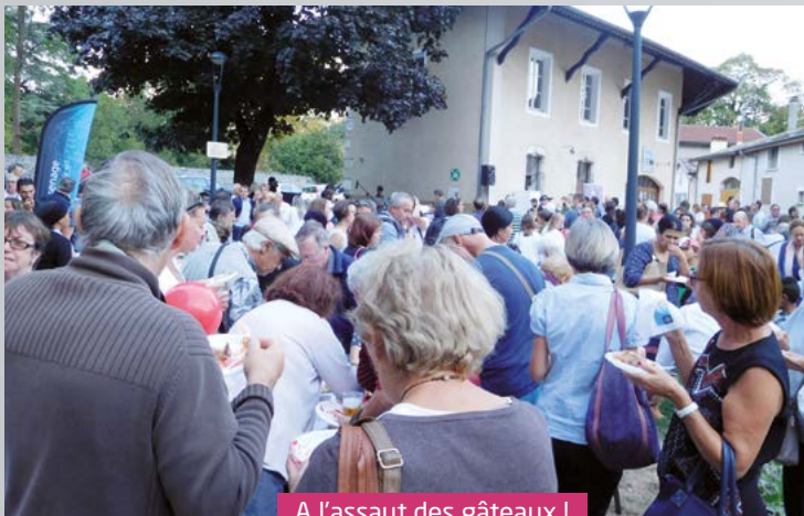
A l'assaut des gâteaux !