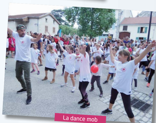
La dance mob