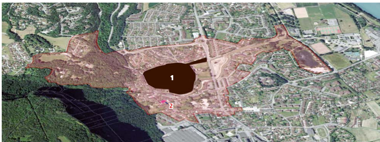
1 Le château de Sassenage