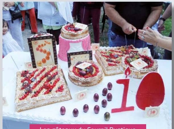
Les gâteaux du Fournil Rustique