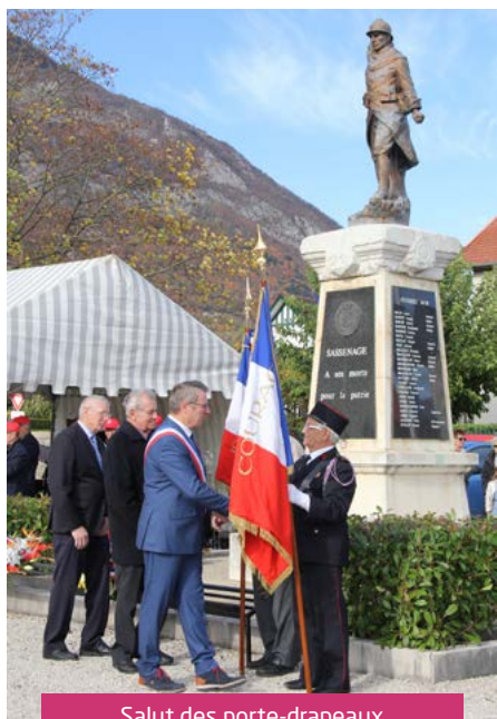
Salut des porte-drapeaux