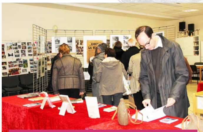
Reliques de la Grande Guerre prêtées par des Sassenageois, et autres ouvrages présentés par la médiathèque l'Ellipse au cœur d'une exposition réalisée par le centre associatif Saint-Exupéry