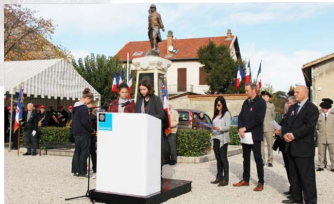
Elèves du collège Fleming et leurs correspondants de la ville de Messkirch unis au pied du Monument aux morts pour lire des textes relatifs à la Grande Guerre, ainsi que le message du Président de la République